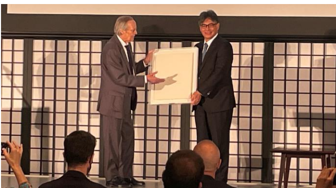
La presentación durante la ceremonia de entrega de premios